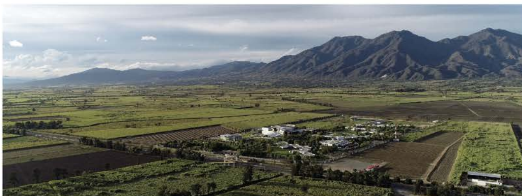
Vista panorámica del Centro Universitario de los Valles

El Centro Universitario de los Valles es la principal institución educativa en la Región Valles. Nuestro campus universitario es líder en formación de profesionistas innovadores y competitivos. A lo largo de 21 años, para cumplir nuestra misión hemos aportado el respeto a la identidad regional y la generación y aplicación del conocimiento a la comunidad mediante una cultura emprendedora, para el desarrollo sustentable de la región.