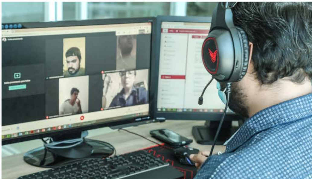
Programa de Formación Docente del CUValles 2020

Con el apoyo de la Coordinación General Académica y de Innovación, se dio continuidad al Programa de Formación para la Innovación Docente (PROINNOVA). En 2020 se impartieron 7 cursos en los que participaron 94 académicos . Asimismo, en el marco del Programa de Formación Docente del CUValles 2020 , se impartieron 9 cursos en los que participaron 124 académicos .