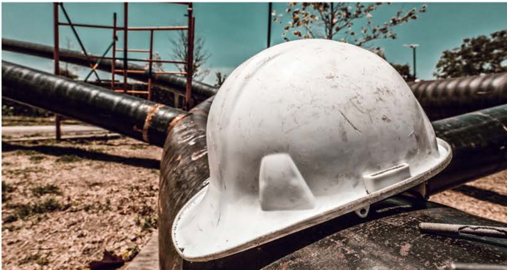
Edificio de Investigación y Posgrado

A lo anterior, se suman los fondos institucionales, participables y específicos , que se aprovechan para la actualización del acervo bibliográfico, el fortalecimiento de la investigación, la permanencia de nuestros posgrados en el Programa Nacional de Posgrados de Calidad, el reforzamiento de la infraestructura, la habilitación del personal docente y para el apoyo a los profesores miembros del Sistema Nacional de Investigadores. Por otro lado, los ingresos autogenerados alcanzaron un poco menos de 12 millones de pesos , que apoyan la operación cotidiana del CUValles.