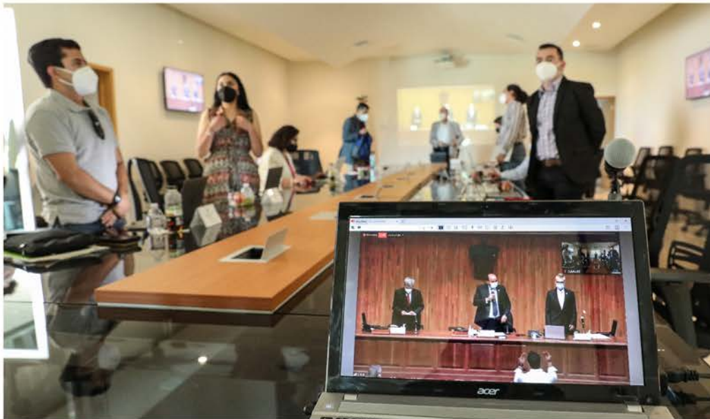
Sesión de Consejo del Centro Universitario de los Valles

Además se llevaron a cabo 7 auditorías , de las cuales 6 fueron terminadas, y las observaciones que surgieron durante las revisiones han sido solventadas en su totalidad.