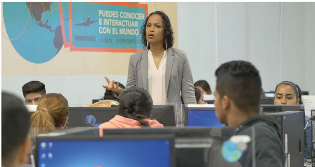
Centro de Aprendizaje Global

El aprendizaje de un segundo idioma sigue siendo una necesidad para los estudiantes del CUValles. Con el apoyo de nuestro Centro de Aprendizaje Global , se atendieron 2,441 estudiantes que realizaron actividades semanales mediante talleres presenciales y plataformas virtuales. Además, a través del programa JOBS para el aprendizaje del idioma inglés, atendimos a un promedio de 212 estudiantes en los dos calendarios.