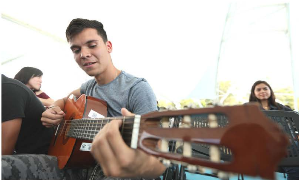
Presentación Talleres de Formación Integral

En total, se presentaron más de 70 proyectos que fueron analizados por un comité evaluador, seleccionando a los ganadores de cada categoría, a quienes se les otorgó un reconocimiento por su esfuerzo.